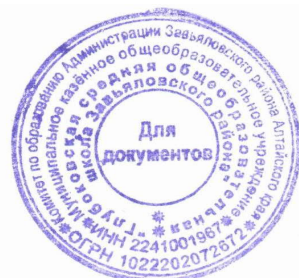
График проведения текущего и итогового контроля в период дистанционного обучения в МКОУ «Глубоковская СОШ»